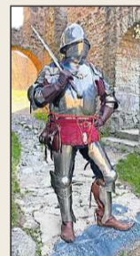
Ein Burgmann.

BURG LICHTENBERG. Seit dem späten zwölften und frühen 13. Jahrhundert bestellten die Burgherren sogenannte Burgmannen, die für die Bewachung (Burghut) und die Verteidigung zuständig waren. Oft waren es raubeinige Gesellen, die ihren Herren auch in „Friedenszeiten“ tatkräftig bei der Durchsetzung seiner Interessen unterstützten. Burgmannen schlossen sich oft zu einer sogenannten Burgmannschaft zusammen, die nach Burgmannrecht lebte. Dieses war nicht einheitlich, sondern von Burg zu Burg verschieden. In Verträgen zwischen dem Herren und dem Burgmann wurden vor allem der Einsatzort, die Zeiten ihrer Anwesenheit, zuweilen auch die erforderliche Bewaffnung und Ausrüstung festgelegt. Die speziellen Wachdienste am Tor, auf dem Bergfried und den Burgmauern übernahm überwiegend das nichtadlige Burgpersonal.