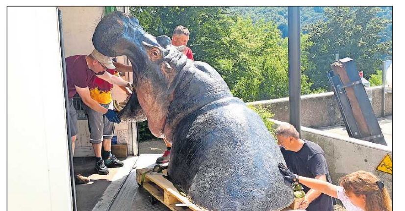
Es brauchte mehrere Helfer, um das sperrige Tier aus dem Lkw zu bugsiieren und ins Museum zu fahren.

Der Geoskop-Mitarbeiter schätzt das Gewicht des sperrigen Ausstellungsstücks auf ungefähr 100 Kilogramm. Beim Transport des Flusspferds hat die Kreisverwaltung unterstützt. |bji